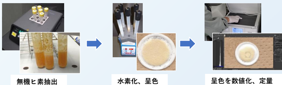
コメ中無機ヒ素簡易測定工程

※2017年にコーデックス委員会で策定されたコメ中ヒ素の汚染の防止と低減に関する実施規範（CXC 77-2017）