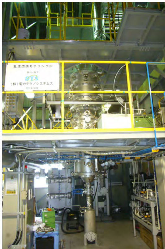
乱流燃焼モデリング炉 (一財)電力中央研究所殿 横須賀地区