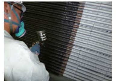
腐食対策用コーティング

特に燃焼炉、電気設備、高圧ガス設備、プラントユーティリティ関連の補修・保守管理を得意としています。