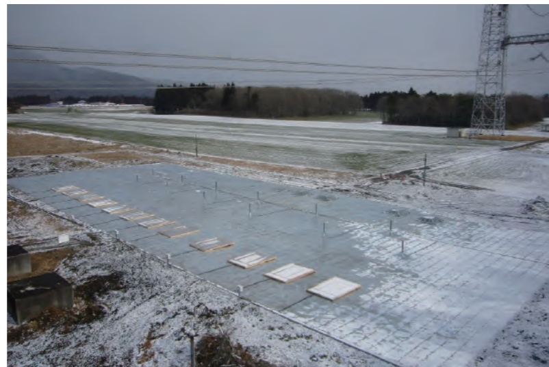
直流送電試験 イオン現象測定システム (一財)電力中央研究所殿 塩原実験場